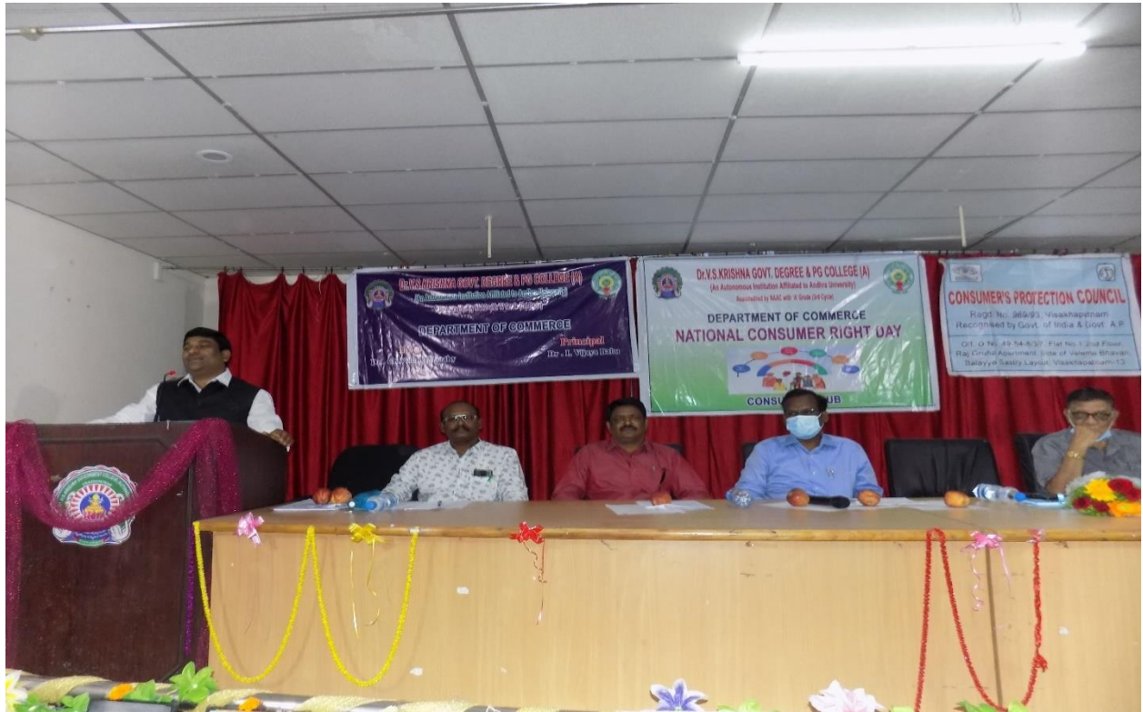
National Consumer day Address by Sri P.K. Lingeswara Rao garu Secretary, Consumer's Protection Council.